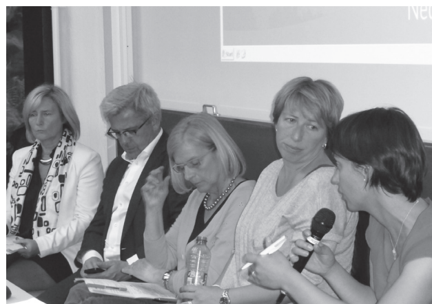
Het onderwijsdebat in Antwerpen. Van links naar rechts :

Liliane Stevens (CD&V), Kris Van Dijck (N-VA), Marleen Vanderpoorten (Open VLD), Caroline Gennez (sp.a), Elisabeth Meuleman (Groen)